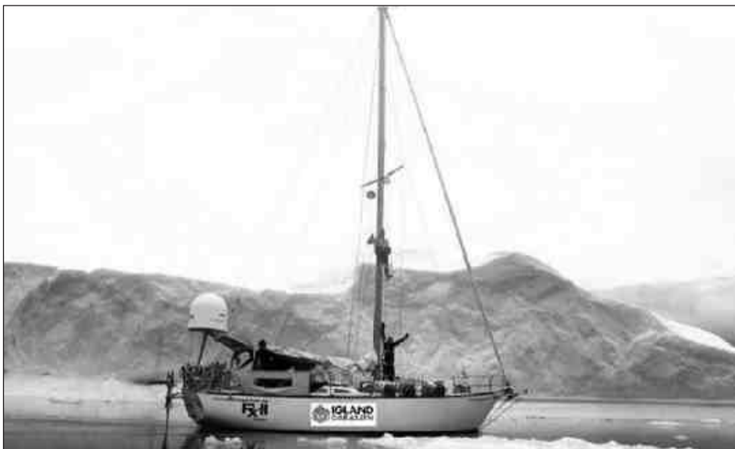
ERFAREN BÅT: "RX II" ble bygd i 1977, og har bevist hva den kan flere ganger før. Nå skal den bli en rekordbåt.

– Hele passasjen stenges etter 45 døgn, og vi regner med å