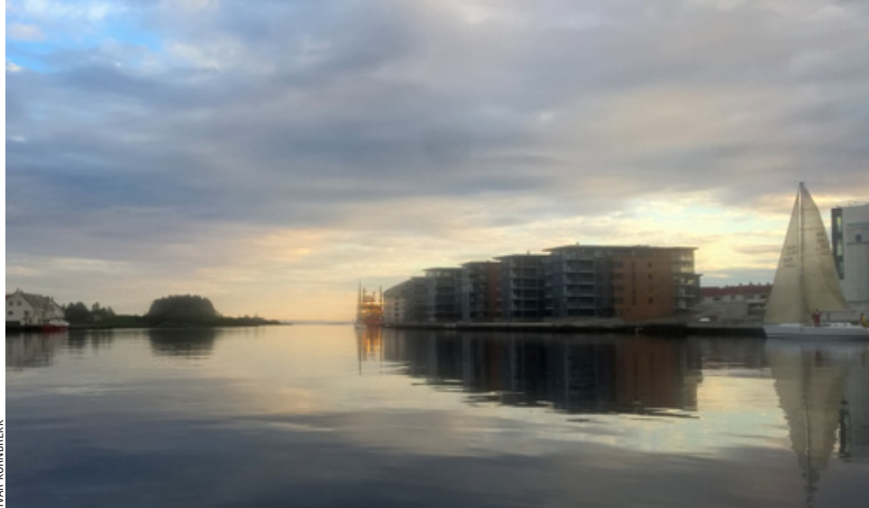
STILLE: Vakkert, men ikke noe særlig for regattaseilere.