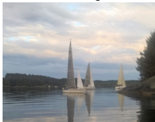
FOR ANKER: Flere av båtene lå for anker i flere timer, et relativt sjeldent syn i regattasammenheng.

Bildene her er tatt i sekstiden. En vakker morgen, men fullstendig blikkstille, og sterk strøm i feil retning.