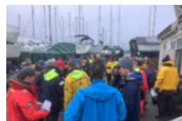
SAMLING: Skippermøte foran Skipperstuen på Søløst. Med 27 deltakende båter var det rundt 100 personer på fjorden – i januar måned!

Vinner i Express-klassen var «Fars Cortina» med den 16 år gamle laserseileren