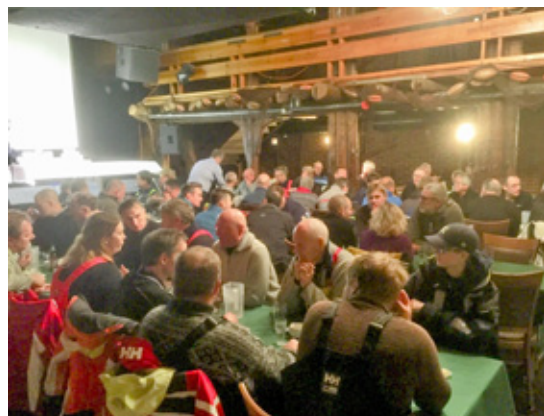
ETTERPÅ: God stemning på De Røde Sjøhusene under premieutdelingen med video-opptak fra regattaen, fiskesuppe og tilbehør.