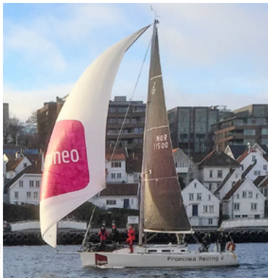
NOR RATING-VINNER: «Promineo Racing» (J/109) seilte meget bra gjennom hele regattaen, gikk først over mål og vant regatta-klassen med god margin.

Det ble i alle fall virkelig en fin dag på fjorden for alle som var med, både som deltakere og funksjonærer. Velkommen til Nyttårsseilas i 2020!