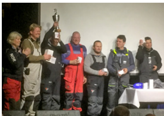
MANNKAP: Et entusiastisk mannskap fra «Promineo Racing» mottar premiene sine, inkludert vandrepokal.

NYTT FRA STAVANGER SEILFORENING • stavangerseilforening.no