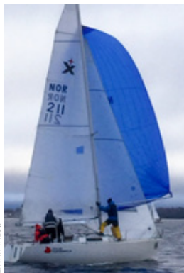
EXPRESS-VINNER: Det ble klar seier i Express-klassen til «Fars Cortina».