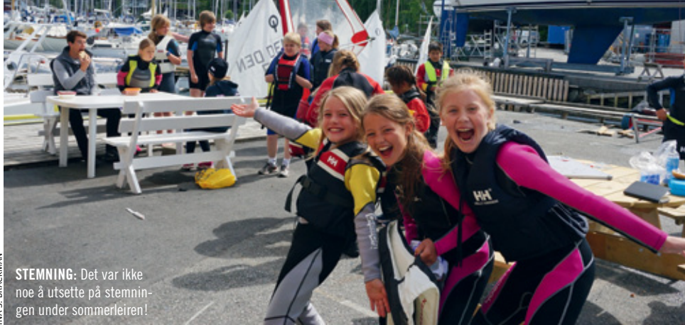
STEMNING: Det var ikke noe å utsette på stemningen under sommerleiren!