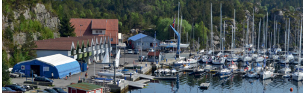
STORT ANLEGG: Askøy Seilsportsenter er et stort anlegg med mange muligheter.

Hugs årsmøtet torsdag 20. februar klokka 19.