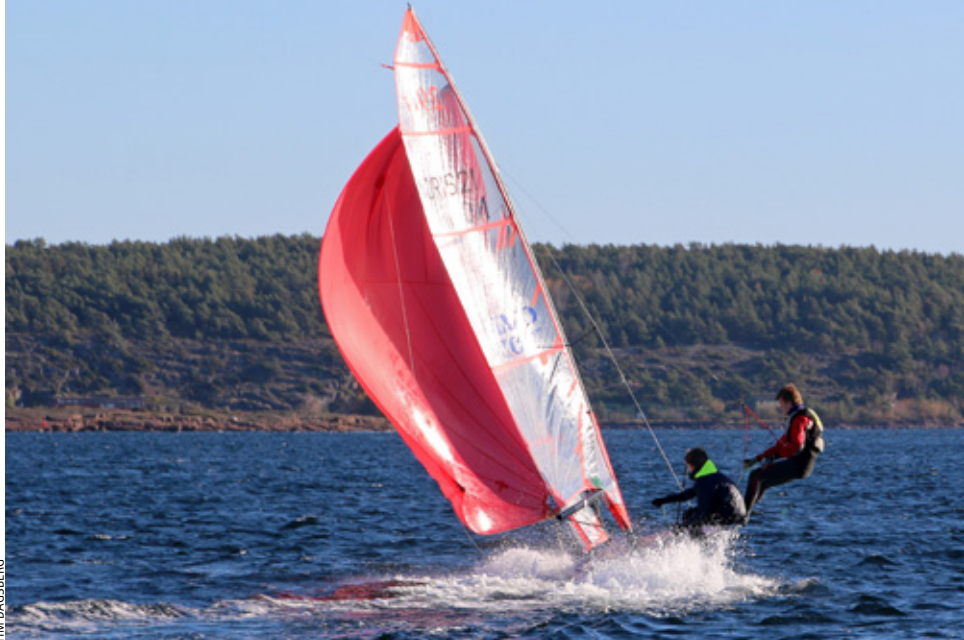
29ER: Tønsberg Seilforening arrangerer årets 29er-EM, og håper at ca 100 båter vil delta.