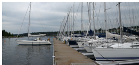
GJESTEHAVN: Spør noen i havna eller havnevakten hvis du er usikker på hvor du kan legge båten. Havnevakten er der mellom 20.00 og 24.00.