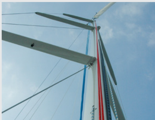
SIKKERHET: Når sjekket du sist riggen?