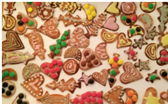
MARIANNE BALSBRUD HESSAN

PEPPERKAKER: 28 kg deig bidro til miljøskapende baking.