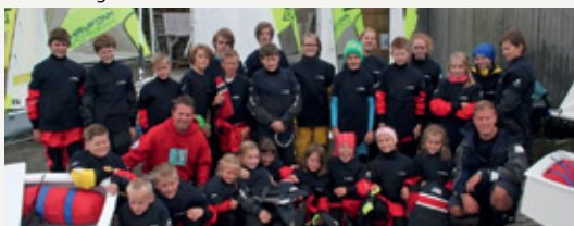
GOD START: 25 seilere fikk en god start på høstsesongen i august.

Vi må samtidig takke Milde Seilforening som lånte oss to RS Feva-båter og våre to nye sponsorer av nye Optimist joller: Rieber-fondet og Volvat. Disse har bidratt til at vi kunne gi alle seilerne båtmateriell og styrke vår videre satsing.