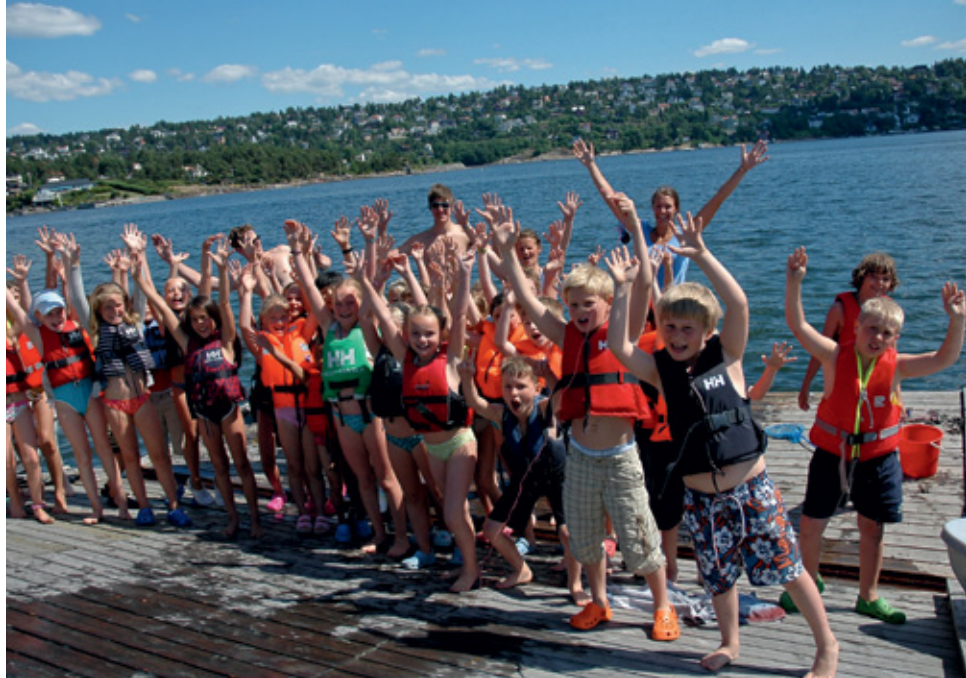
LIV OG RØRE: I Bundefjorden er det liv og røre gjennom sommermånedene.