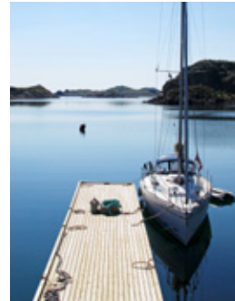
HAVN: Vakre Gullvika med sin idylliske badestrand har fått gjestebrygge og er virkelig verdt et besøk.

Nordsiden av Lofot-øyene er spektakulær. Likevel, skal du