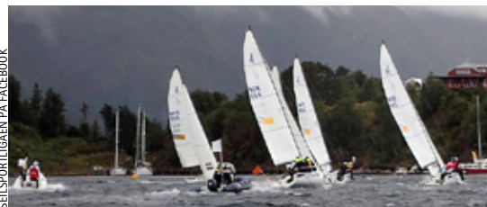
SEILSPORTLIGAEN PÅ FACEBOOK

I MOLDE: Kan vi håpe på slike scener på Moldefjorden i 2016?