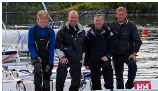
SEILSPORTLIGAEN PÅ FACEBOOK