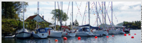
EGEN ØY: Stavanger Seilforening har en hytte med et romslig bryggeanlegg på en egen øy i Ryfylke – Langøy.