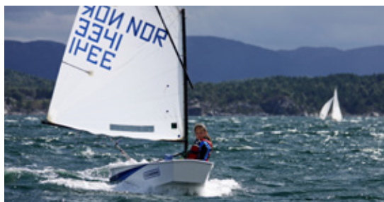
LIKESTILT: Jenter og gutter hevder seg omtrent likt i optimistklassen.

som seilere utvikler lokalt, nasjonalt og internasjonalt, er en side ved seilingen som er temmelig unik om man sammenligner sporten med de fleste andre sportstilbud til barn og unge, og som mange har stor glede og utbytte av både i barne- og ungdomsårene – og senere i livet.