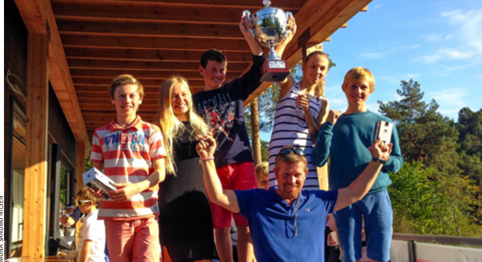
LAG-NM: Ran Seilforenings førstelag vant NM i lagseiling.