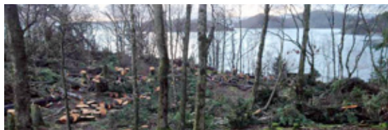
ETTER NINA: Så åpen har antakelig ikke skogen på Langøy vært siden tidlig i forrige århundre.

NYTT FRA STAVANGER SEILFORENING • stavangerseilforening.no