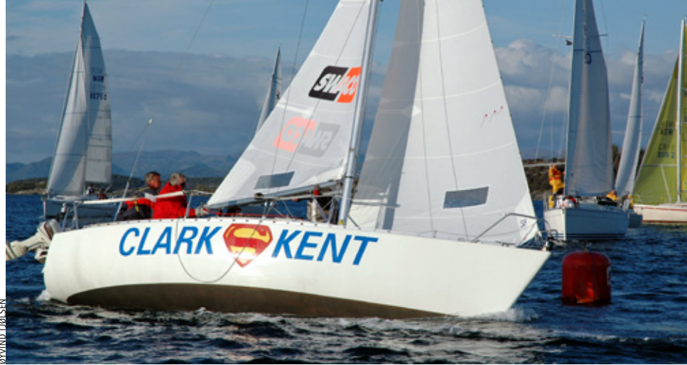
FINE FORHOLD: Expressmiljøet i Stavanger er stort og sammensatt og forholdene på Åmøyfjorden er gode.