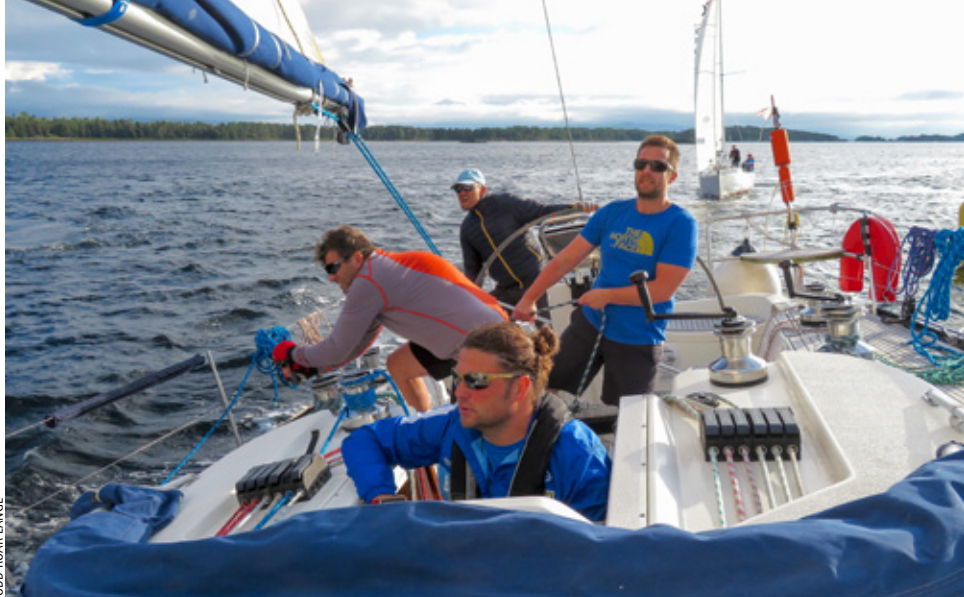
STORE GLEDER: Molde Race Week ble seilernes drømmehelg på fjorden – Molde Dream Week.