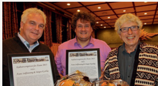
PRIS: Åsane Historielag tildelte oss Kulturvernprisen for foreningens innsats på øya. Prisen er på 10 000 kroner.