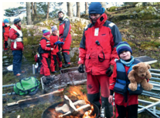
SAMLINGER: Det er fokus på lek og moro blant barn og ungdom.

forening i Optimist. På nyåret planlegger vi nye spennende aktiviteter og arbeidet for at jollegruppen skal fortsette sin positive utvikling.