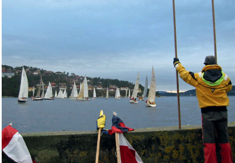
NEGLESPRETT: 11. januar er det klart for den 33. utgaven av Neglespretten.