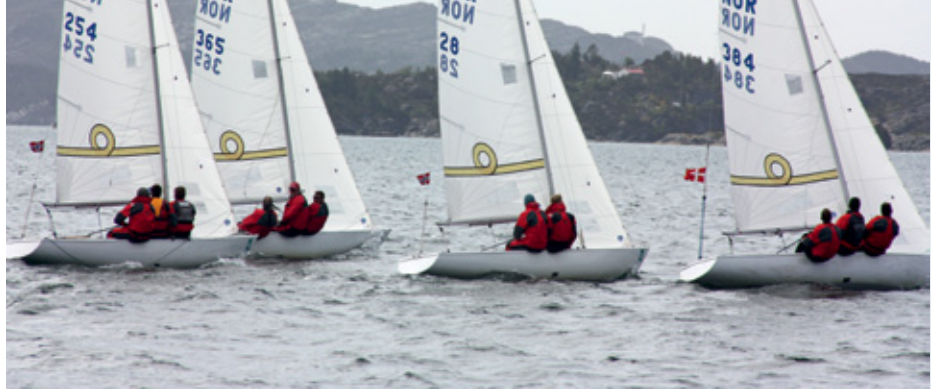
YINGLINGER: Sammen med Sjøkrigsskolen har Askøy Seilforening snart 26 Ynglinger.