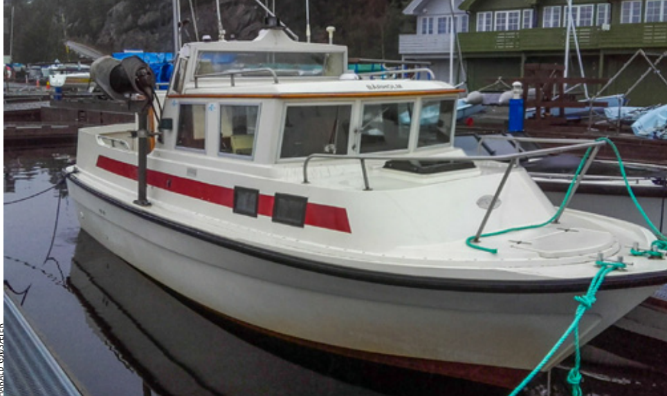
STARTBÅT: Askøy Seilforenings nye startbåt, «Kaggekongen», fortøyd på plassen sin.