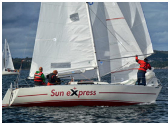
FEMTE SEIER PÅ RAD: SUN EXPRESS vant Byfjordtrimmen for femte gang i år. Kanskje ønsker de seg sterkere konkurranse?

Kona One Design er en regattaklasse med raskt økende utbredelse i hele verden. Rigg velges etter seilerens vekt, eventuelt etter seilerens ferdighetsnivå. For Åsane Seilforening har Kona One Design vært et flott supplement til Bic- og RSX-klassen, samtidig som det har gitt oss et opplæringsbrett for et bredt spekter av seilere i alder og vekt.