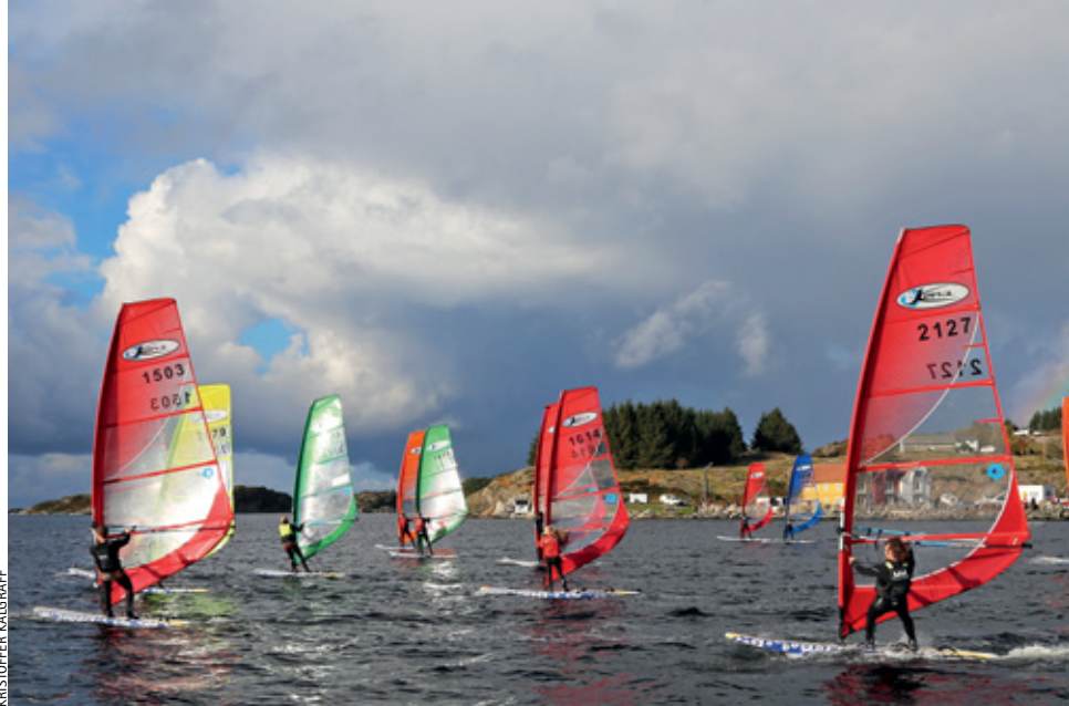
NM KONA: Etter venting en hel lørdag, kunne arrangørene avvike seks seilaser i fine forhold på søndagen.