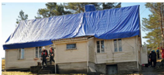
HOVEDHUS: Restaureringen av hovedhuset er godt i gang.

Vi har også stor aktivitet ovenfor mulige sponsorer/samarbeidspartnere for finansiering som er helt nødvendig for at vi skal lykkes med våre byggeplaner.