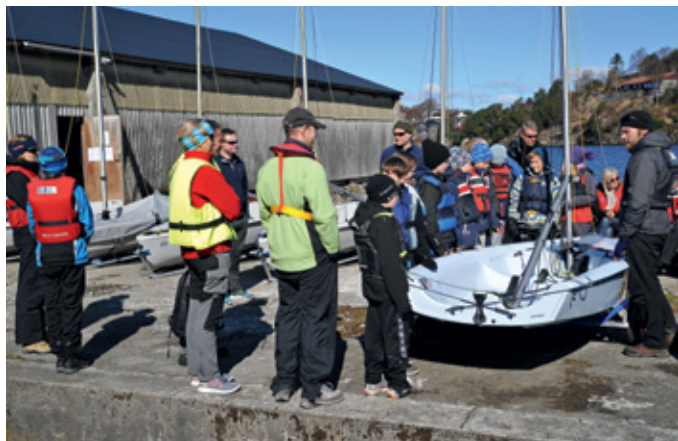
20 NYE: På den første rekrutteringssamling var det 20 nye seilere.

skal klare ved hjelp av våre dyktige trenere for både våre yngste Optimist-seilere og våre RS Feva-seilere.