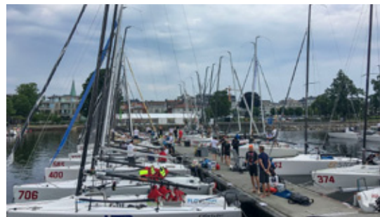
MANGE: Med nærmere 200 seilere var arrangementet et stort løft for Christianssands Seilforening.

Hvis noen ønsker å mimre litt, ligger det noen videoer på YouTube. Se for eksempel https://www.youtube.com/watch?v=QfnF3bLB3I8&t