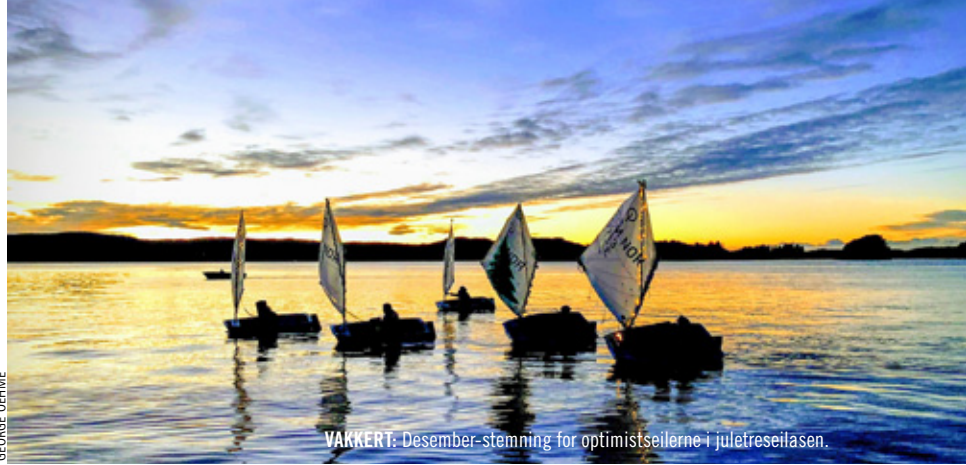
VARKERT: Desember-stemming for optimistseilerne i juletreseilasen.