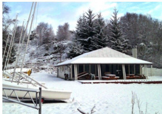
STILLE: «Nina» har sust videre og det er atter en fredelig vinterstemning på Lindøy.