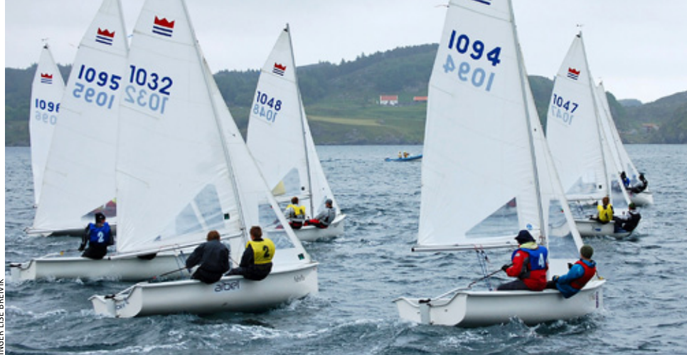
NM: Haugesund Seilforening arrangerer lag-NM i 2-Krona i 2015.