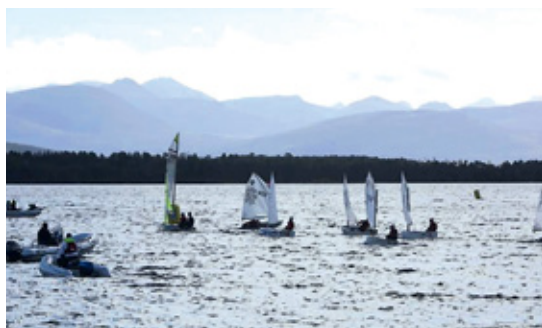
ODD ROAR LANGE

Molde Seilforening takker Ålesunds Seilforening for regattaen og festen. Vi ser frem til å fortsette samarbeidet om InterCity i fremtiden!