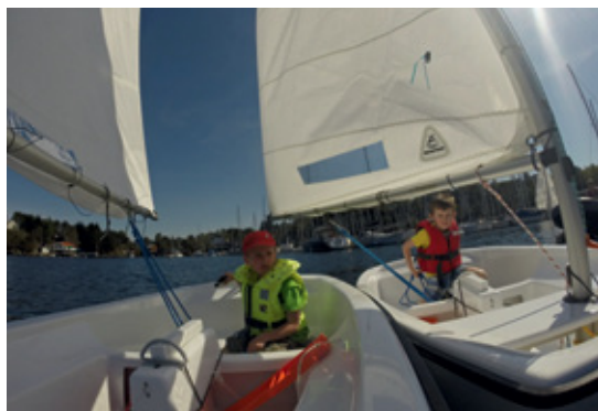
DE YNGSTE: Det vokser til nedenfra i Bergens Seilforening.