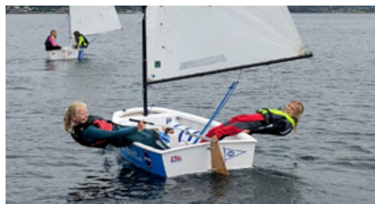
GØY: Det er morsomt å være flere i båten, syntes deltakerne.

Barna fikk seile både i Optimist og RS Feva. Spesielt de litt eldre barna synes det var artig å kunne seile sammen i en RS Feva. Fire stykker i en jolle var visst ikke noe problem. Vi har dessuten fått en nyoppstartet klubb i byen,