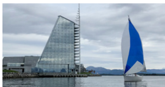
HØSTSTORMEN: Ikke akkurat storm, men stort sett nok vind.

AV LARS WALLE • Seilasen ble gjennomført i pent høstvær og stort sett med vind gjennom hele seilasen. Løpet som ble valgt var mer eller mindre en rett linje mellom starten ved Fjærestua og ut til Stabeflua, like vest om Tautra. Her ble løpet avkortet da det ville tatt alt for lang tid å seile tilbake til startutgangspunktet. Raskeste båt i mål var «Jake» (J/70), som brukte