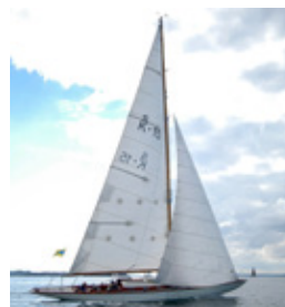
NORSK: Etter 85 år i Danmark kom SK 15 tilbake til Norge i 2003.