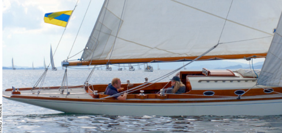
7-METER: «Ambition» ble bygget på Anker & Jensens båtbyggeri i 1918. I dag er hjemmehavnen Bergen.