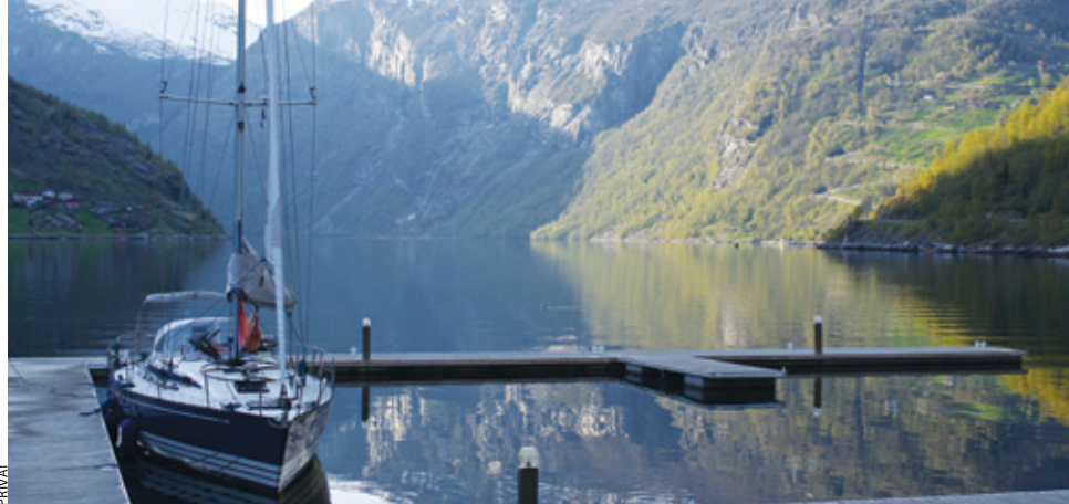
FØR SESONGSTART: TEA ligger ved gjestebryggen i Øye i Hjørundfjorden.