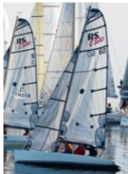
RS ELITE: Lettseil og rask kjølbåt.

Avkastningen på vår investering er nok blant de bedre i seilbåtverdenen.