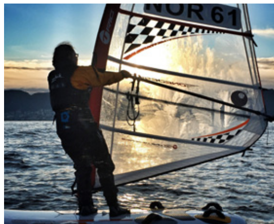
VINTER: Frisk vind, minus syv grader i luften og is i seilet.

samling sammen med storbåtseilerne og heder og ære på de unge friske seilerne som til tross for kulden hadde hatt en flott dag på fjorden.