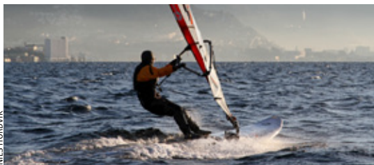
SESONGSTART: Det var første gang brettseilerne deltok i Neglespretten og de hadde en flott dag på fjorden.

teringsevent nært sentrum i Bergen – nærmere bestemt Store Lungårdsvann ved AdO arena – i forbindelse med Ekstremportsveko på Voss.