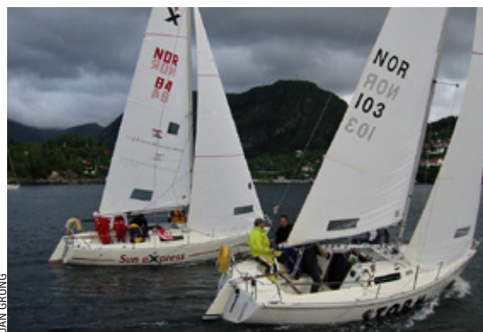
BLI MED: Midt i uken passer det godt å lufte både vettet og seilene.

NYTT FRA ÅSANE SEILFORENING • www.aasane.no