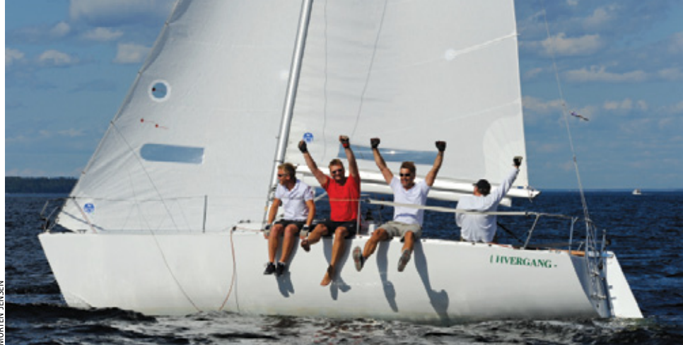
GULL: Jubelen sto «i taket» om bord i HVERGANG da gullet var et faktum.