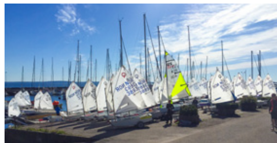
SPRING CUP: Nesten 50 jolleseilere deltok på Spring Cup i begynnelsen av mai.

I Pinsen var det leir på Fjærholmen, et fast innslag i programmet og et kjempeflott arrangement der barna får mye fin og god læring. Så synes også vi voksne at det er et fint sted å være!