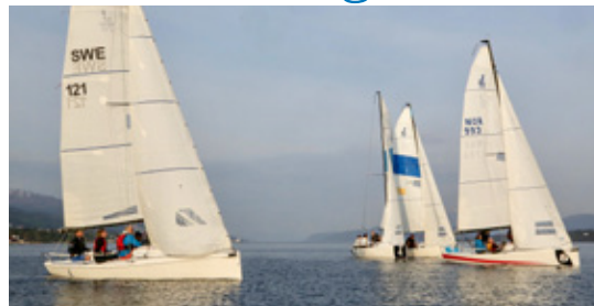
ODD ROAR LANGE

MED BREDE SMIL. – Dermed får vi kompetanseoverføring fra første dag på sjøen, og vi får vist at det ikke er nødven-