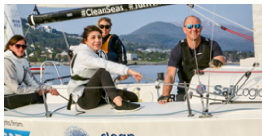
ODD ROAR LANGE

SAMMEN: J/70-seiling har gitt fornyet mulighet til å dele seilgleden på regattabanen og har gitt Molde Seilforening et nytt rekrutteringsløft.