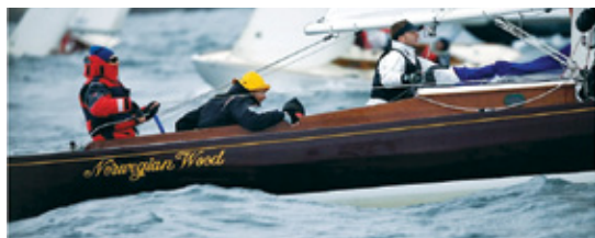
ANNERLEDES: I IOD VM bytter seilerne båter mellom hvert race.

Vi oppfordrer publikum til å ta med kikkert og håper at de får oppleve regattaspenningen i et internasjonalt seilmiljø denne uken.