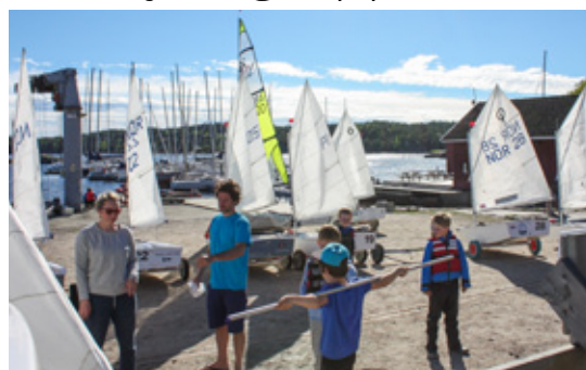
MANGE: Hele femten barn og ungdom er nye i årets barn- og ungdomsgruppe.

Vi avslutter treningen med å spise kveldsmat sammen, noe som er blitt fast innslag og veldig populært.