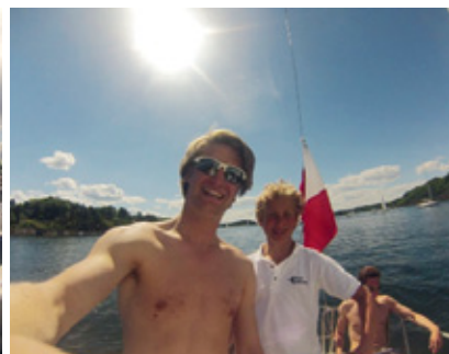
EN GLAD GJENG: Team ASBJØRG utgjør en glad og munter gjeng som seiler mye og har godt med selvironi.