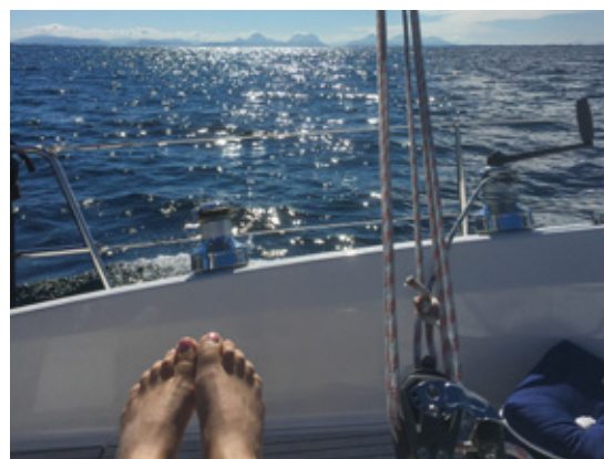
TUR: Prosjektet Seil Ut har økt seilaktiviteten i Molde Seilforening.

Se www.moldeseilforening.no/tur-hav for mer informasjon.