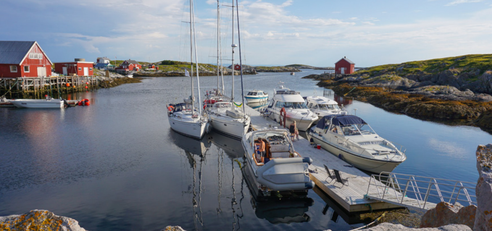
HAVN: Sør-Gjæslingan er en sikker havn og gammelt fiskevær ved Folda.