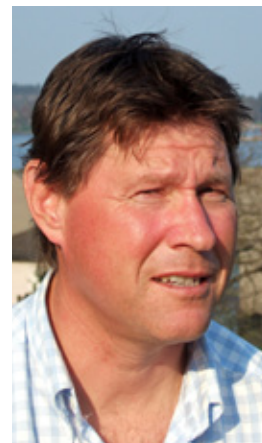
EIRIK: Storbåt, X-382.

6. Nå håper jeg selvfølgelig på en like god sommer som i fjor. I tillegg ser vi frem til NORC-rankingen, Færderseilasen og Hollænderseilasen.