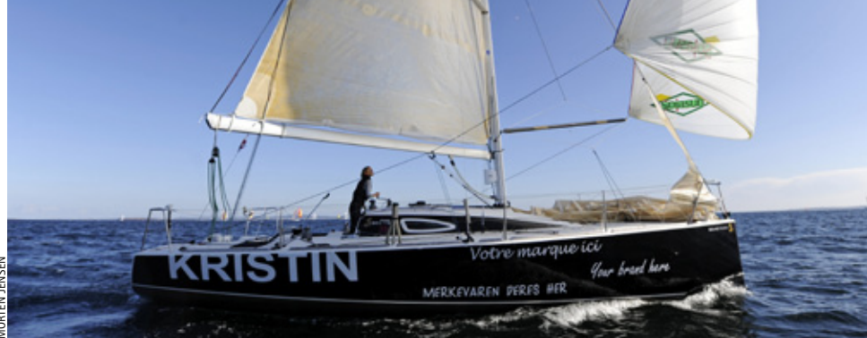
ALENE: I OneStar er du alene om bord på godt og vondt.