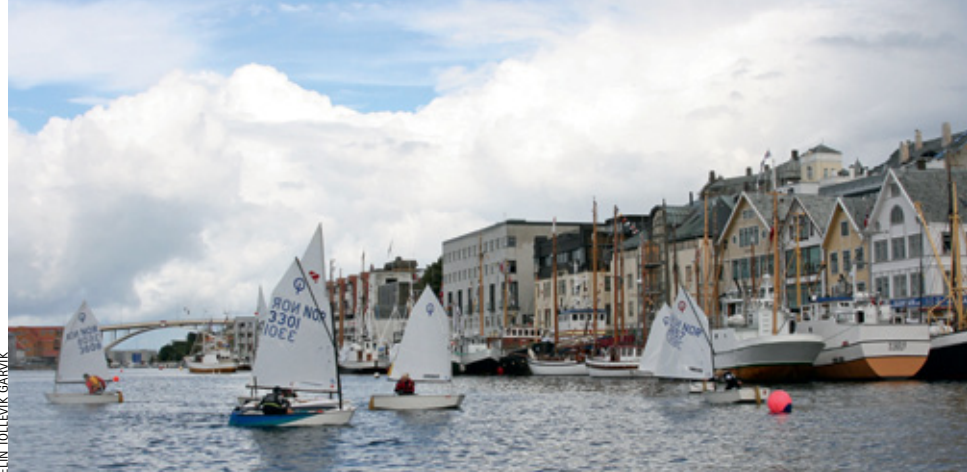
MIDT I BYEN: Klubbregatta i Smedasundet for jolleseilerne under Havnedagene i Haugesund.