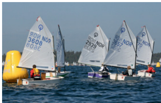
REGATTAER: NC i Arendal – et av årets mange høydepunkter.

Ekstra gledelig er det at klubben i tillegg til en aktiv gjeng med litt mer erfarne seilere også har en stor og loven-de nybegynnergruppe. I år har totalt åtte helt ferske seilere gjort en stor innsats for å lære seg å mestre Optimisten, og de vil forhåpentlig sikre høy aktivitet i jollegruppen i mange år fremover.