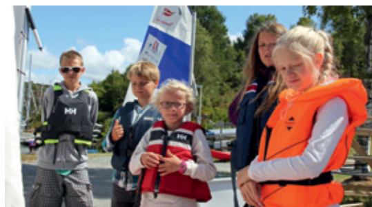
POPULÆR SOMMERLEIR: «Gøy på vannet» har blitt så populær at den i år ble arrangert over to uker.

NYTT FRA HAUGESUND SEILFORENING • www.haugesundseilforening.no