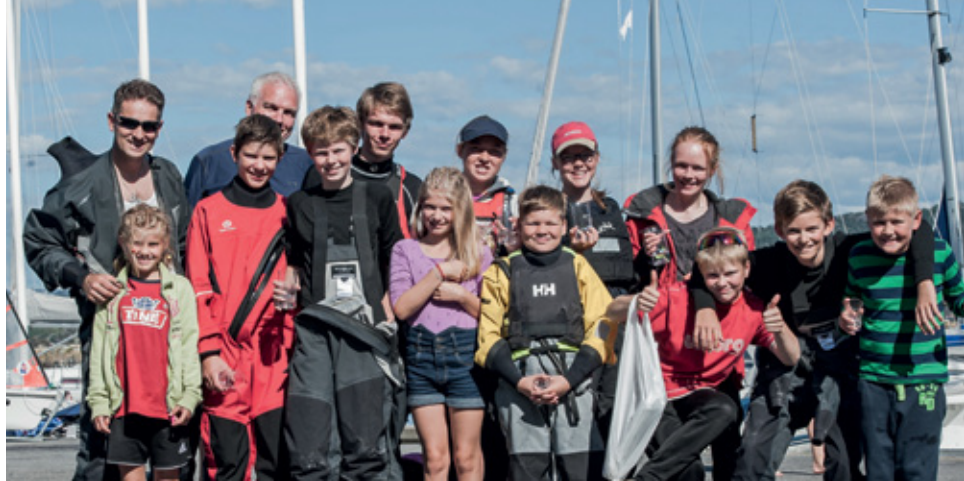
KM: 12 seilere fra Åsane Seilforening deltok i kretsmesterskapet i RS Feva og Optimist i Hordaland.