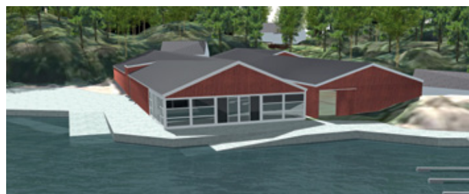
PASS: Med de planlagte endringene på Storøen vil det bli utvidet plass for noen og enhver.

luftsråd, Speideren og Bergen Kystlag et stort fokus på å tilrettelegge øya bedre for allmenheten som et flott friluftsområde.