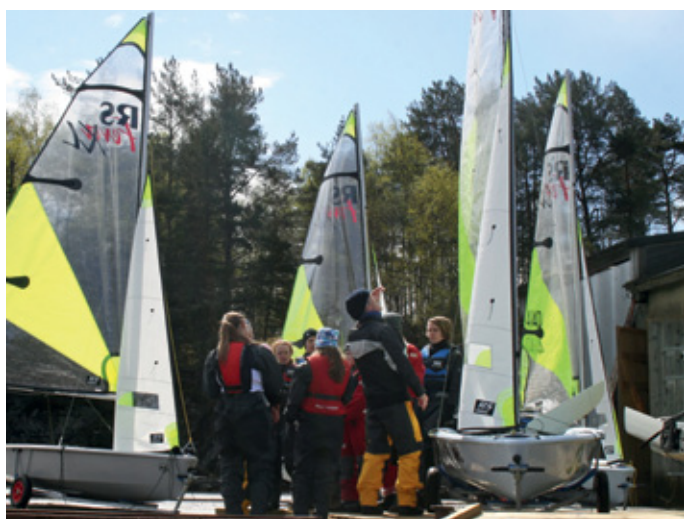
JOLLESEILERE: Våre joller er i trening gjennom vinteren.

Dette har vært veldig positivt og bidratt til å holde miljøet aktivt gjennom vinteren før vi starter jollesamling helgen 16.–17. mars og begynner med vanlig ettermiddagstrening fra 8. april.