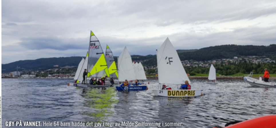
GØY PÅ VANNET: Hele 64 barn hadde det gøy i regi av Molde Seilforening i sommer.

NYTT FRA MOLDE SEILFORENING • moldeseilforening.no