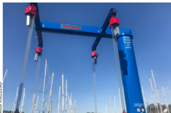
KRAN: Ny kran på plass i Bergens Seilforening.

Husk også at det i uke 26 (25.–29. juni) er sommerseilskole i Bergens Seilforenings anlegg på Hjellevad. Påmelding innen 1. juni via sailracesystem.no .