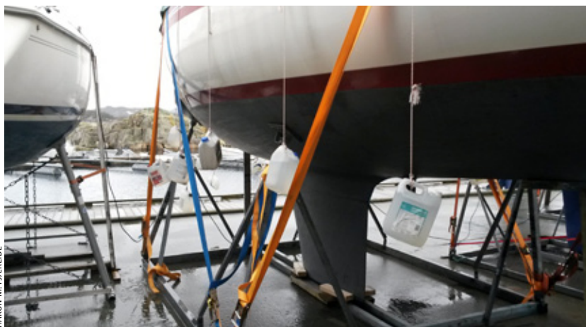
HÅKON M. FJÆREIDE

KREFTER: En krybbe med båt uten riggen forskjøv seg ca. 50 cm forrige gang det var storm.