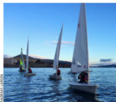
PÅ VANNET: Endelig er de ivrige seilerne på vannet med Laseren.