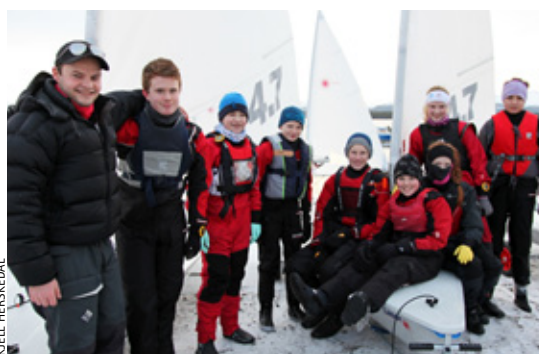
UTE: Spente seilere er klare for vannet. Under treningsleiren deltok tilsammen ni seiere i Laser og RS Feva.

– Om innsatsen og lærekurven holder seg like bratt, går vi spennende tider i møte, avslutter Larsen engasjert.