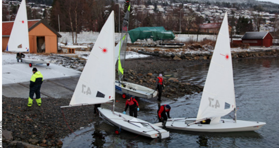
LASER: Molde Seilforening satser for fullt på Laser.