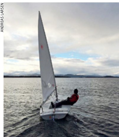
ROLIG: Laserdebuten foregikk under rolige forhold.