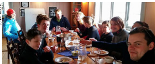
INNE: Det er både godt og viktig med noe varmt å spise etter en kald økt i januar.