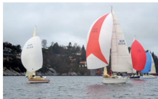
NEGLESPRETTEN: 33 ganger er Neglespretten blitt arrangert.

For flere resultater og bilder og reportasjen henvises det til aasane.no .