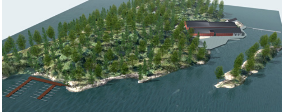
UTBYGGING: Åsane Seilforening er et godt steg nærmere seilspottanlegg på Storøen.