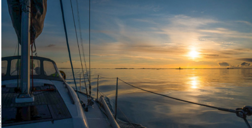
SOLNEDGANG: Turen til Bodø bød på både rufsevær og havblikk.